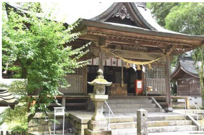
鳥居をくぐり階段を上ると拝殿が見えてきました

まずはあゆの里から 車で15分。 甲佐の中でも歴史ある 甲佐神社をご紹介します。 肥後国二宮で阿蘇神社の 二の宮とも呼ばれています。