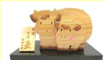
今年の干支・丑（親子）

早くも来年の干支制作中。 11月頃より販売予定です。 進行状況はSNS等で 随時お伝えしていきます。