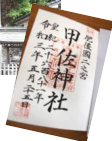
御朱印も頂きました