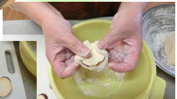
ポイント!小麦粉で包む 卵、牛乳を入れたら柔らかくなる