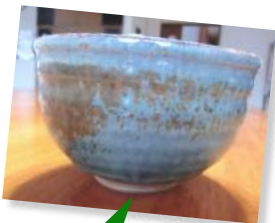
器も世話人さんが 作られました。