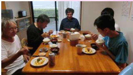
みんなで (いただきます～す)