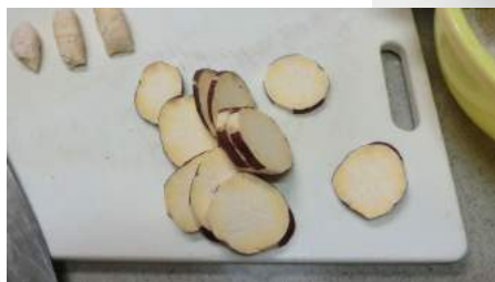
サツマイモは7～8cmの厚さに!