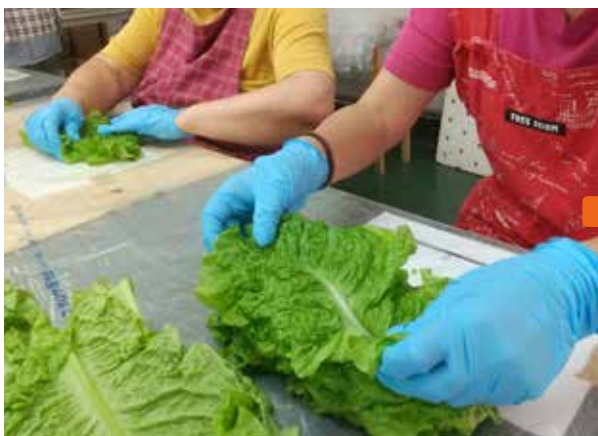
♪ 葉物野菜を一枚一枚検査しながら、丁寧に重ねて…