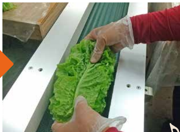
♪ パック詰め機械に流していきます。